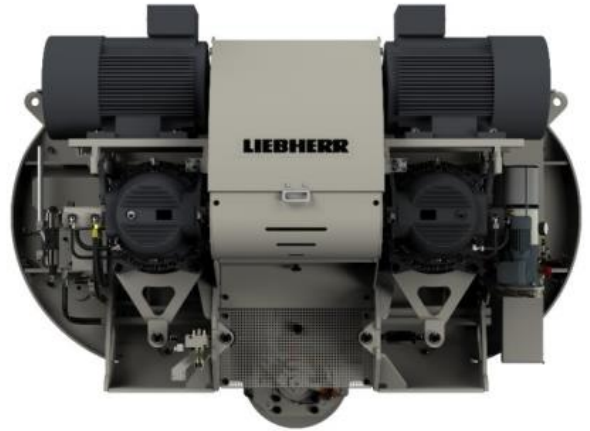
Engranajes planetarios LIEBHERR de alta eficiencia