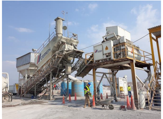
Planta CEMEX Nuevo Aeropuerto