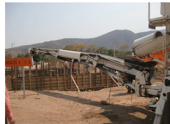
Bandolla lista para recibir el concreto