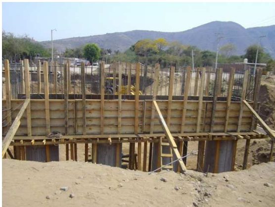
Puente a colar