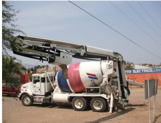
Despliegue y acomodo del brazo para dejar en posición