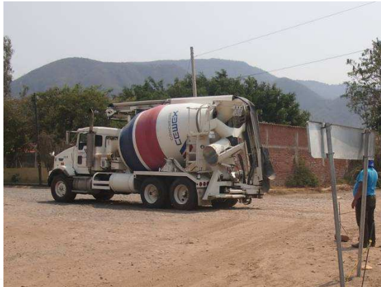
La Bandolla llega al lugar