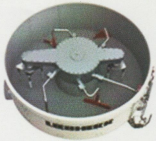
Eje vertical (Ring-pan mixer)

Mezcladores Centrales adaptables a la Planta Dosificadora